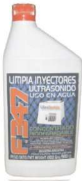
Botella x980 cc

Limpieza de Inyectores por Ultrasonido en Agua Corriente Soluciones Totalmente NO Inflamables